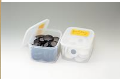
(解説用紙製 7 路盤とマグネット碁石)

② 入門用教材の贈呈:紙製 7・9 路盤と囲碁入門ガイドを参加人数分贈呈します。