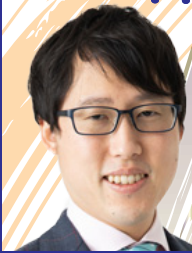
井山 裕太 棋聖・名人・本因坊