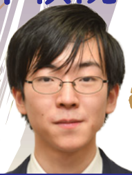
芝野 虎丸 王座