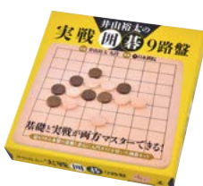
GA8 井山裕太の実戦囲碁9路盤