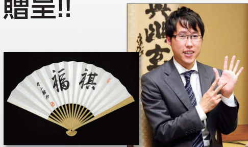
棋福 (幸せ・幸福) ※写真はサンプルです。実物とは異なります。