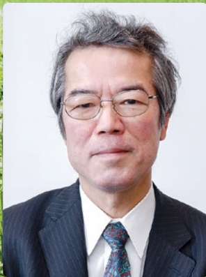
二十四世本因坊秀芳