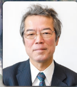
二十四世本因坊秀芳