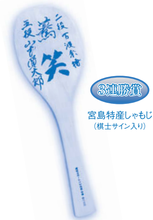
宮島特産しゃもじ (棋士サイン入り)

● 大会に3連勝された方には、 宮島特産しゃもじ(棋士1名の サイン入り)をさしあげます。