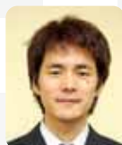
仲邑 信也 九段