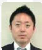
中野 寛也 九段