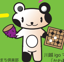
川越 igo マスコット 「かわ碁え丸」