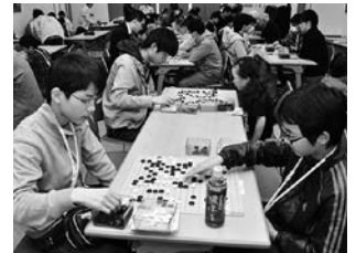
igoまちキッズの様子

※教室の日程・会場は川越 igo まち倶楽部のホームページをご覧ください。お電話等でお問い合わせください。