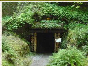
龍源寺間歩(イメージ)

龍源寺間歩は、石見銀山にある最大級の久保間歩に次いで長く約600mある杭道です。そのうち一般公開されている273m(新杭道含む)をご覧ください。