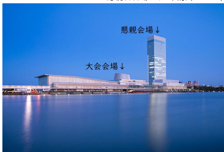
朱鷺メッセおよびホテル日航新潟(イメージ)