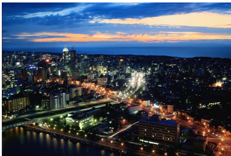
懇親会会場からの夜景(イメージ)

信濃川が日本海に注ぐ雄大な景色を地上 125m から眺めながら、お食事をお楽しみ下さい。 会場の都合上、先着 180 名で締切とさせていただきます。