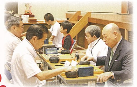
昨年第1回大会の様子