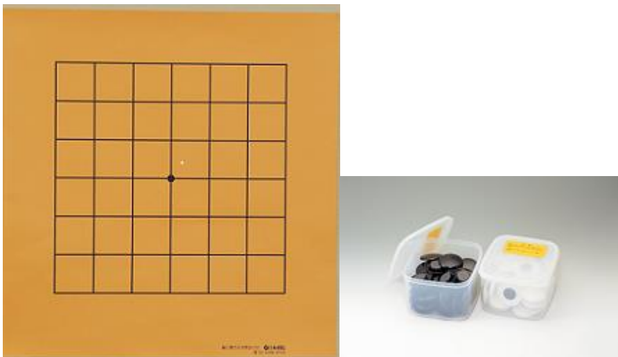
※紙製 7 路盤

※貸出品に破損・紛失があった場合、次年度の申請で教材の貸し出しをお断りする場合がありますので、返却の際は確認をお願いします。